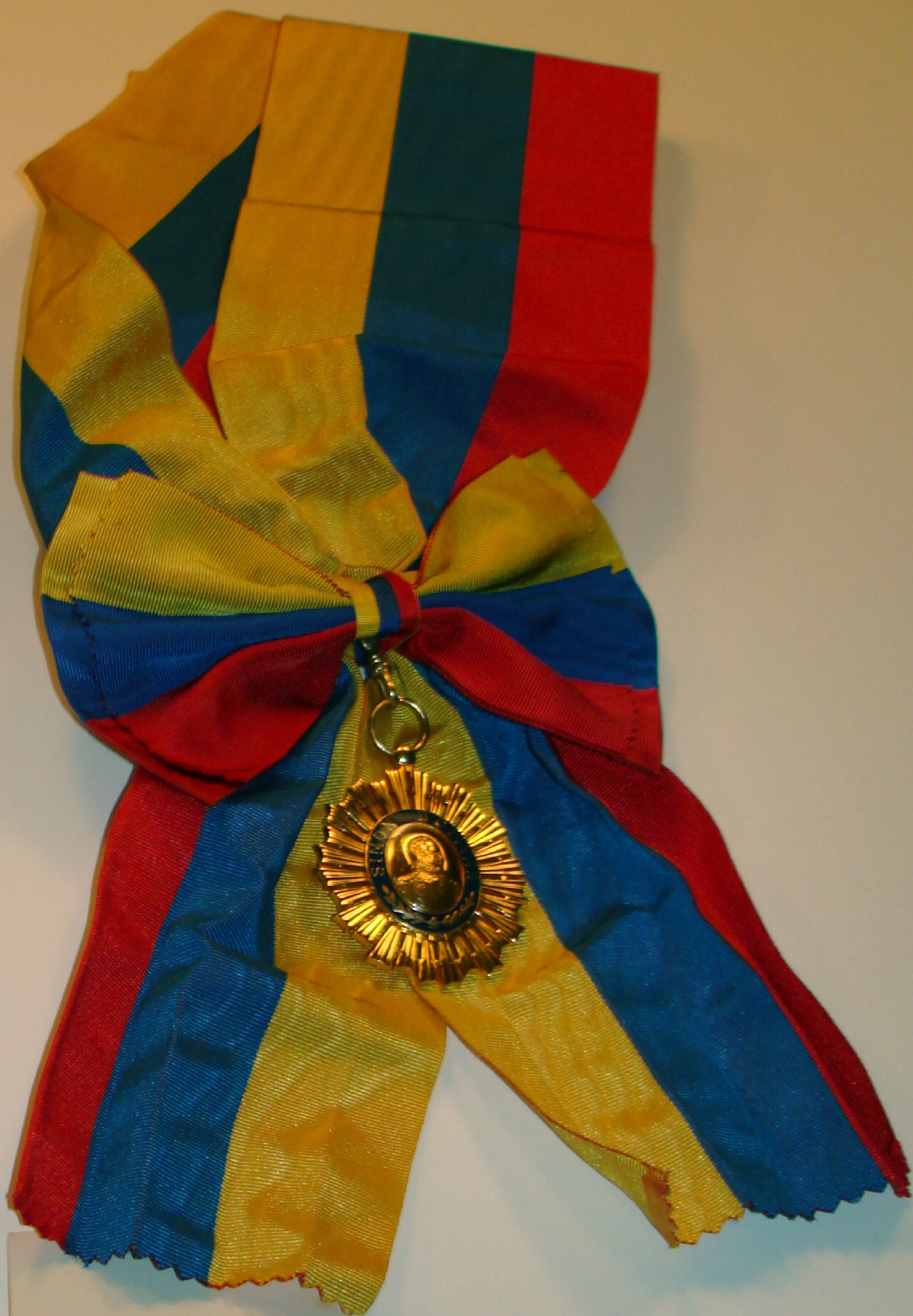
Order of Simon Bolivar - Venezuela -